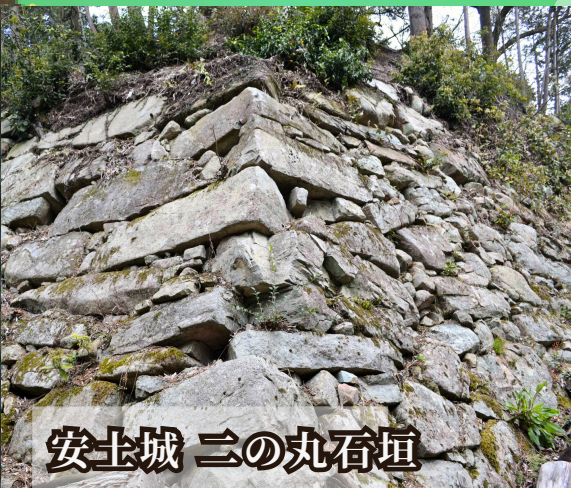
安土城 二の丸石垣